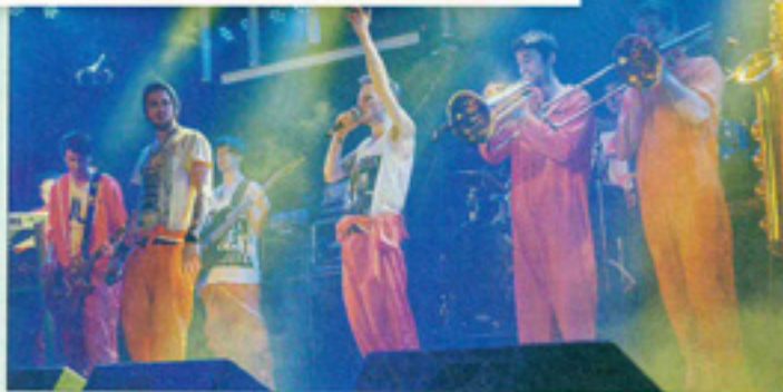
„Jimmy and the Goofballs“ sind demnächst unter anderem beim „Eastrock-Festival“ und beim „Dolomitenmann“ on stage.

Die Band wurde im Herbst des Vorjahres gegründet und setzt sich aus zwei Gitarristen, einem Keyboarder, Bass, Drummer sowie einem elfköpfigen Bläser-Set zusammen. Die Musik ist ein Mix aus Funk, Hip Hop, Brass und einer Briese Rock über ganz Österreich von Wien über Graz bis nach Lienz. Die Musik ist nicht nur in Österreich, sondern auch in Deutschland und den USA sehr beliebt.