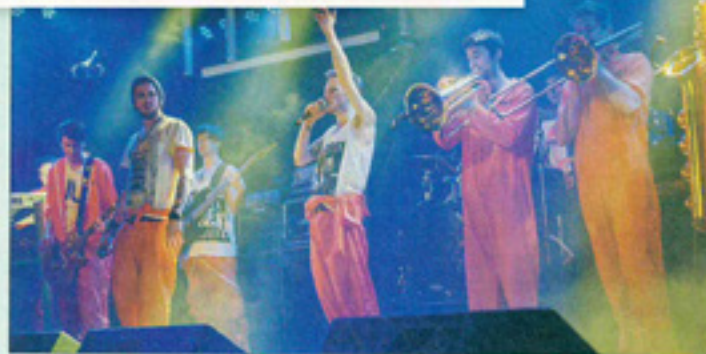
„Jimmy and the Goofballs“ sind demnächst unter anderem beim „Eastrock-Festival“ und beim „Dolomitenmann“ on stage.